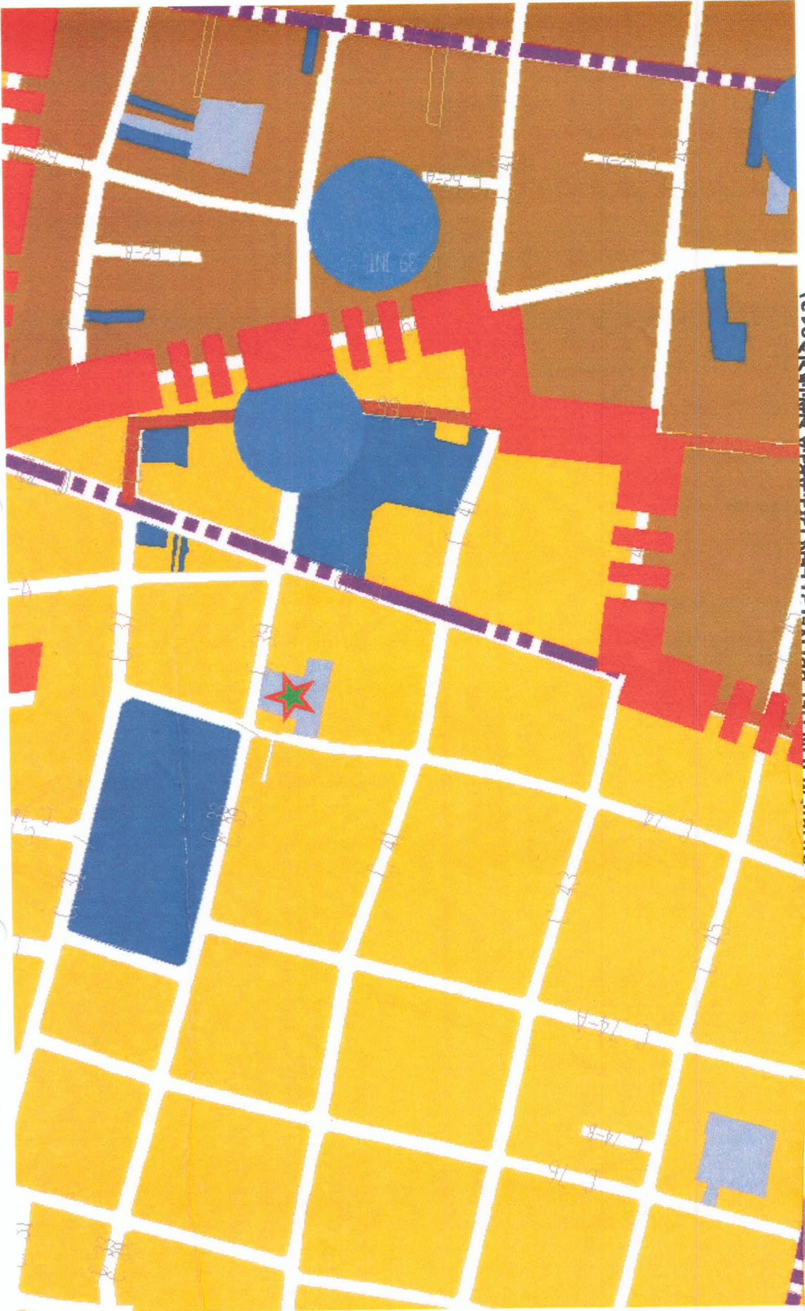
LOCALIZACIÓN EN LA ZONA (CARTA SINTESIS PDUMI 2012)

Proyecto: Oficinas a Gran Escala Calle 39 #512-D Col. Centro, Mérida Yucatán