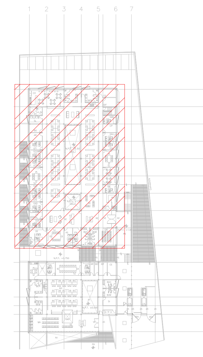
CROQUIS DE UBICACION ESC: 5:1