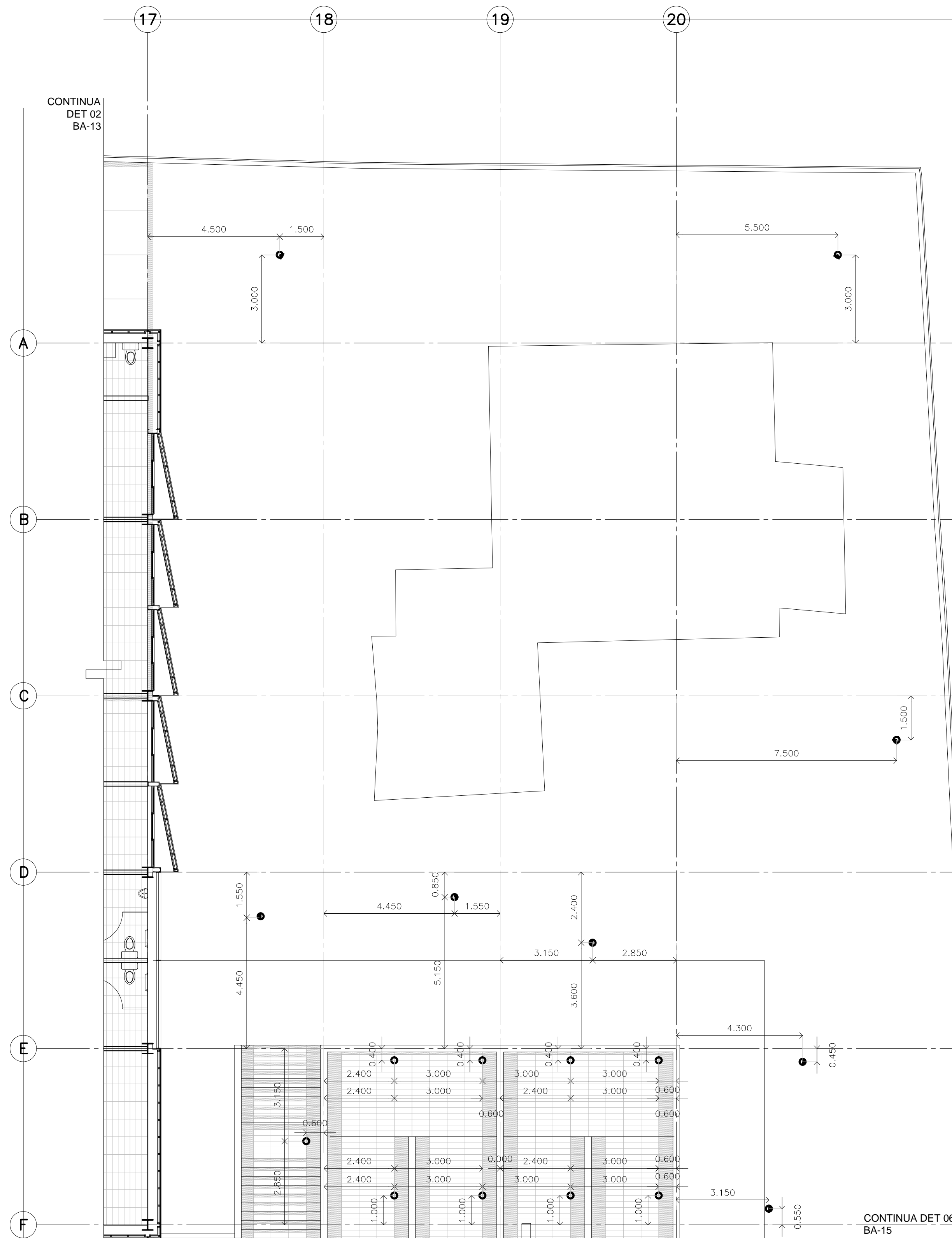
DETALLE 5 LUMINARIAS EXTERIORES NIVELES ±0.000 Y +3.000