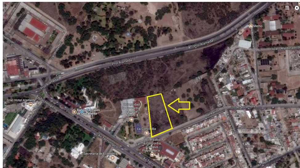
Fig. 1 Localización del emplazamiento del “CESI Aguascalientes”.

Compuesto por un predio de forma irregular y topografía plana. Con base a la constancia de alineamiento las medidas generales son las siguientes, al norte colinda con Técnica Inmobiliaria S.A. y condueños 40.16m, al este con el predio 2 de la subdivisión 100.46 m, al oeste con Internacional de Estudios Humanistas A.C. y al Sur con la calle Balneario 52.10.