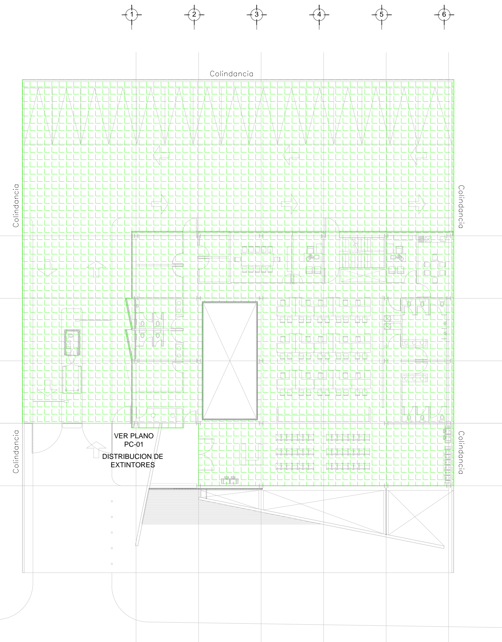
PLANTA BAJA - NIVEL 0.00 ESC. 1:200