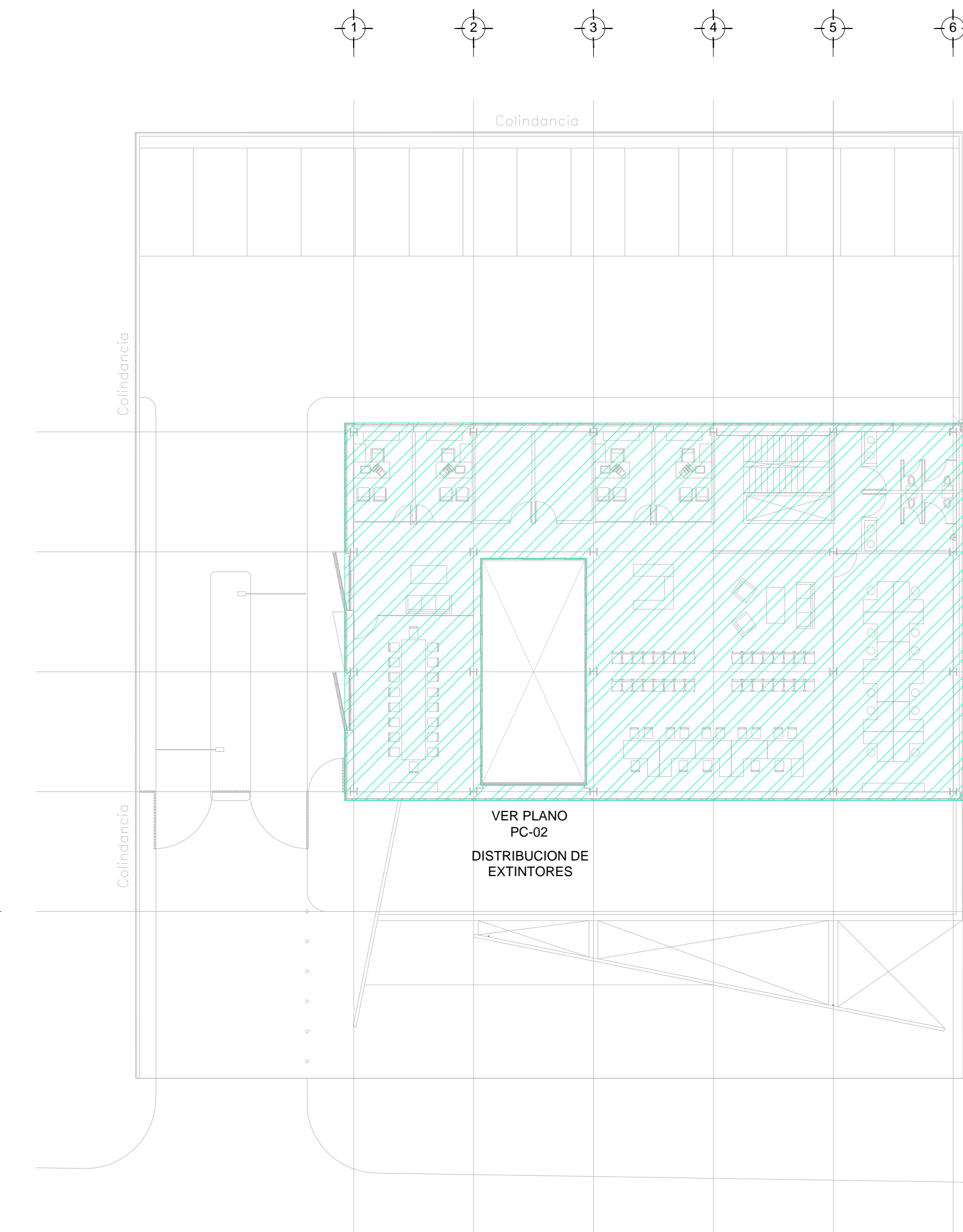
PLANTA ALTA NIVEL + 3.90 ESC. 1:200