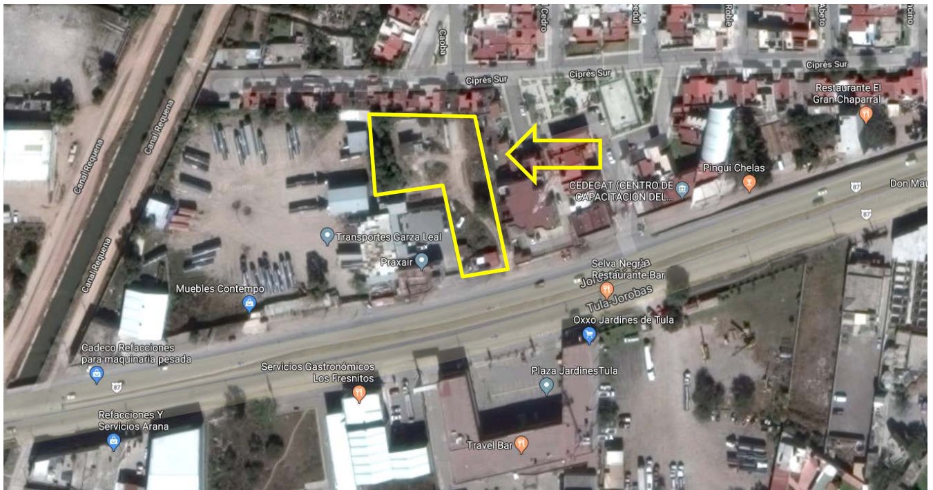
Fig. 1 Localización del emplazamiento del “CESI TULA”.

Compuesto por un predio de forma irregular y topografía plana. Con base a la constancia de alineamiento las medidas generales son las siguientes, al Norte colinda con Propiedad privada, al este con Propiedad privada, al oeste con Praxair y al Sur con Carretera Jorobas-Tula.