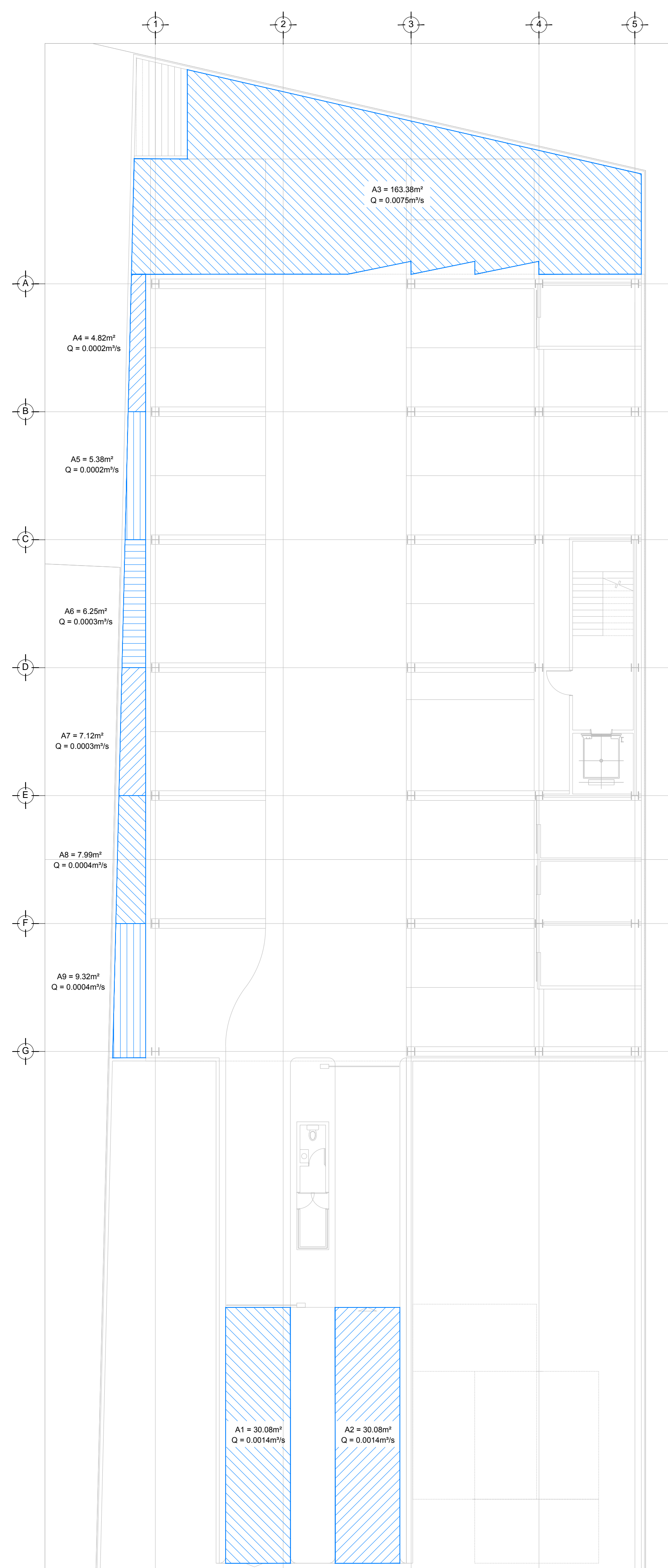
DRENAJE PLUVIAL - COBERTURA PLANTA NIVEL -1.50 ESC. 1:130