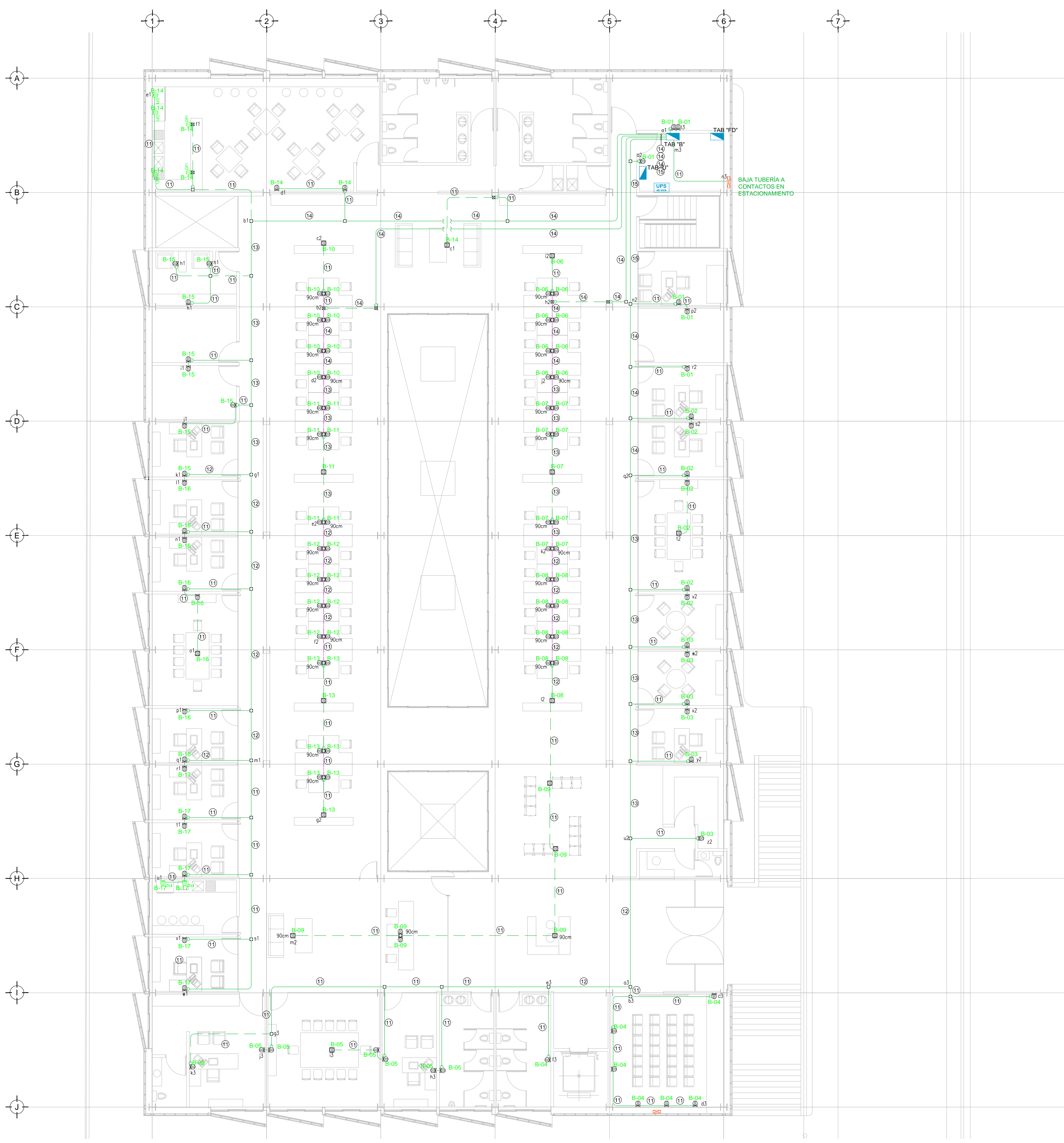
TENDIDO DE INSTALACIÓN ELÉCTRICA CONTACTOS NORMALES (DELEGACION) N.P.T +3.00 mts. ESC: 1:125

NOTA: LA UBICACIÓN EXACTA DE CONTACTOS SE DEBE VERIFICAR EN PLANOS ARQUITECTÓNICOS.