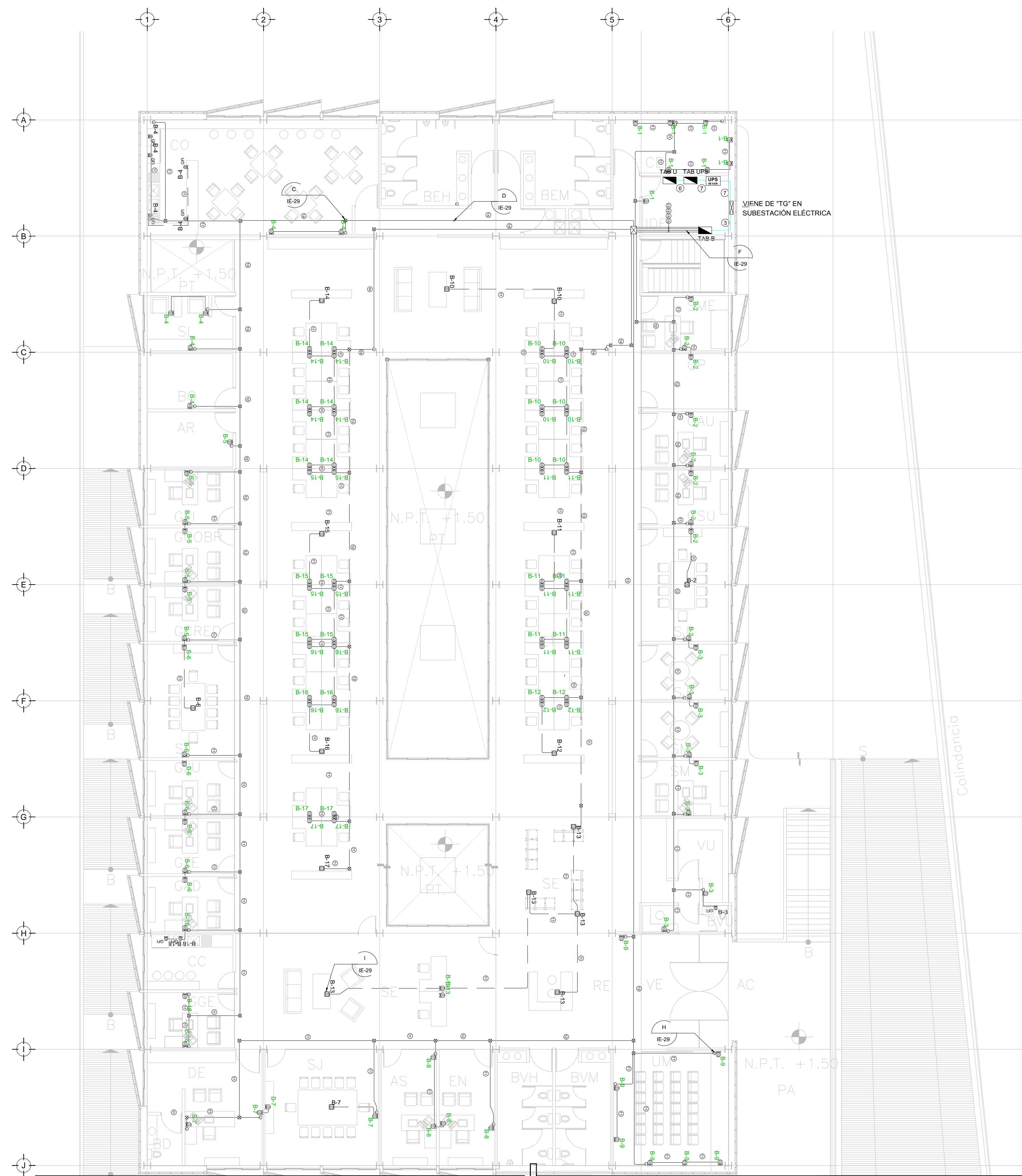
TENDIDO DE INSTALACION ELÉCTRICA (CONTACTOS NORMALES) N.P.T. +1.50 mts. ESC: 1:125