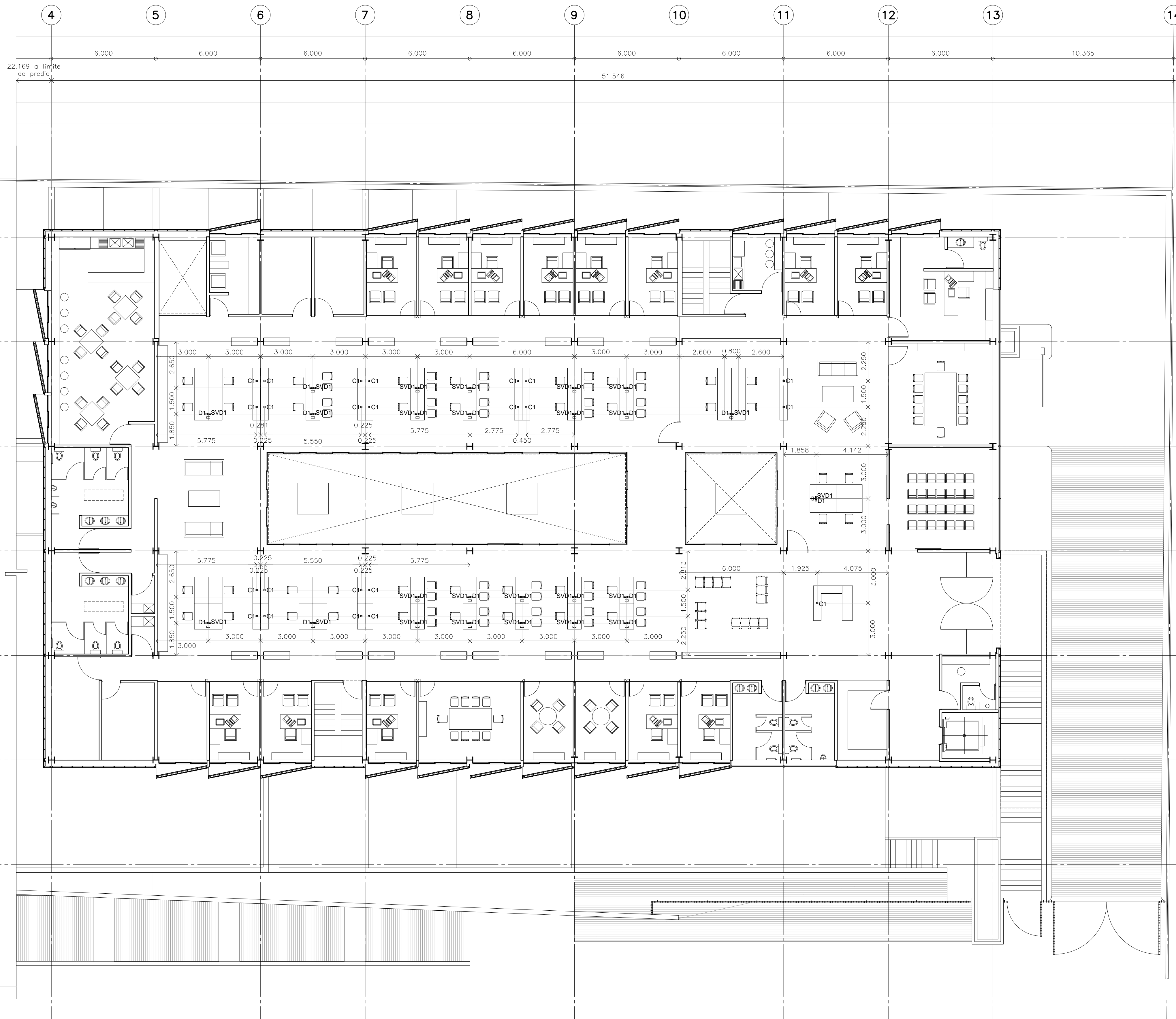
PLANTA ARQUITECTÓNICA DELEGACIÓN N. +3.900 DETALLE DE CONTACTOS ELÉCTRICOS EN PISO