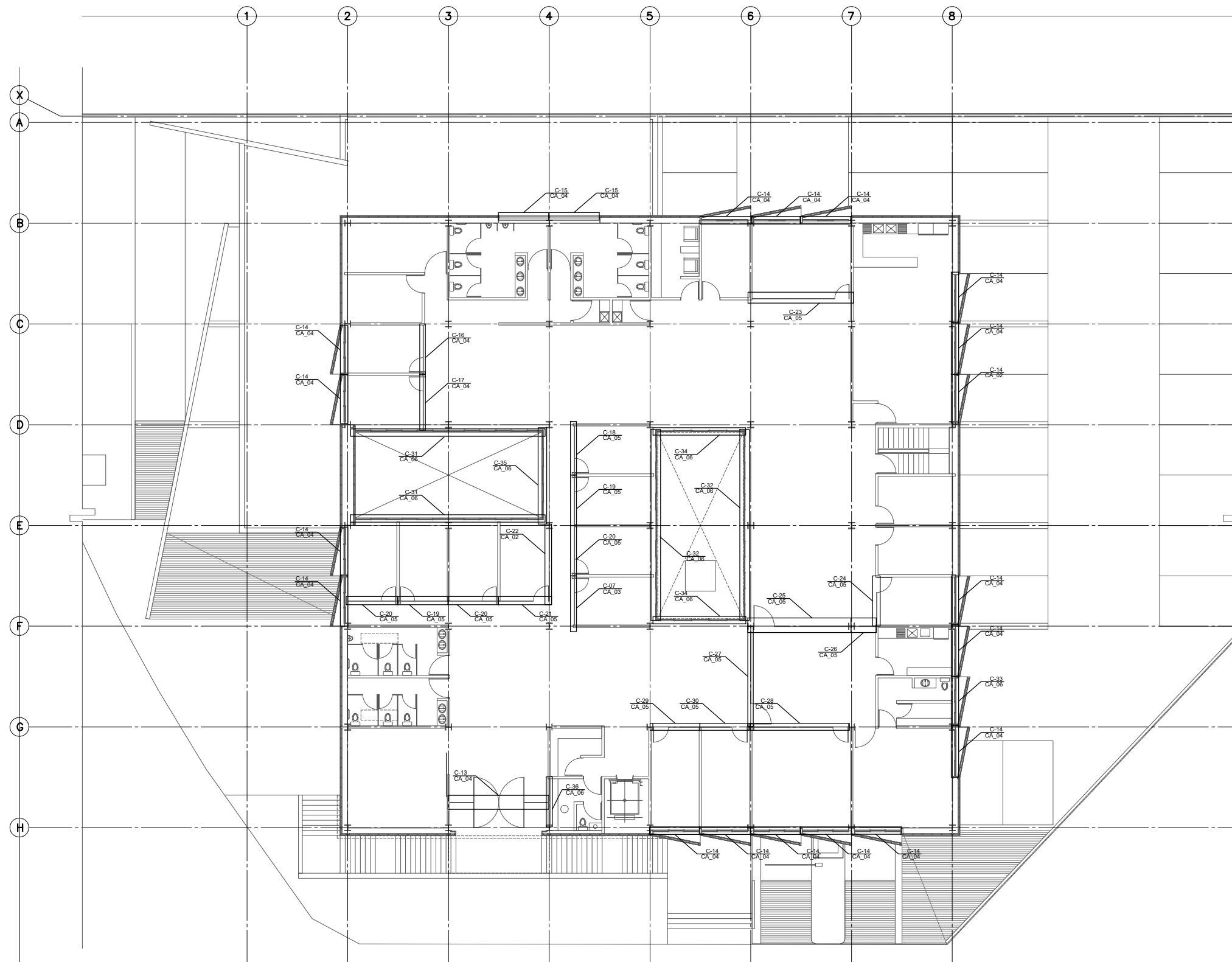
PLANTA ARQUITECTÓNICA NIVEL +3.900