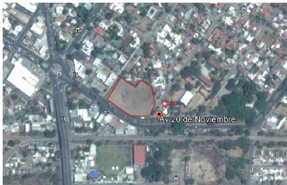
Fig. 1 Localización del emplazamiento del “Centro de Servicios Colima”.

Compuesto por un predio de forma irregular y topografía plana. Con base a la constancia de alineamiento las medidas generales son las siguientes, al norte colinda con un Predio particular, al este con un Predio particular y la calle Simón Bolívar, al oeste con predio particular y la calle prolongación 20 de Noviembre y al Sur con la esquina formada por las calles de Simón Bolívar y Prolongación 20 de Noviembre.