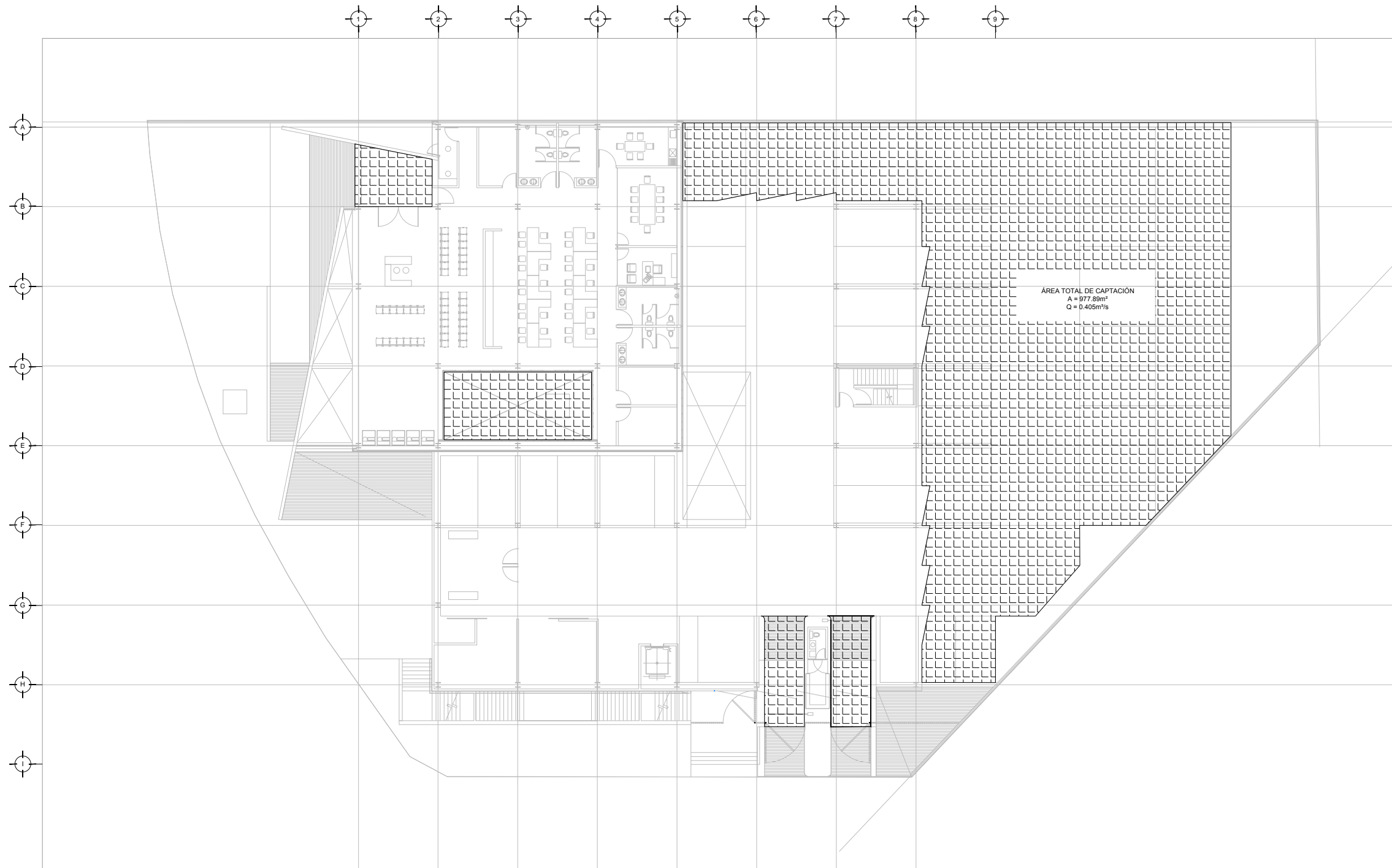
DRENAJE PLUVIAL - PLANO LLAVE PLANTA BAJA ESC. 1:150