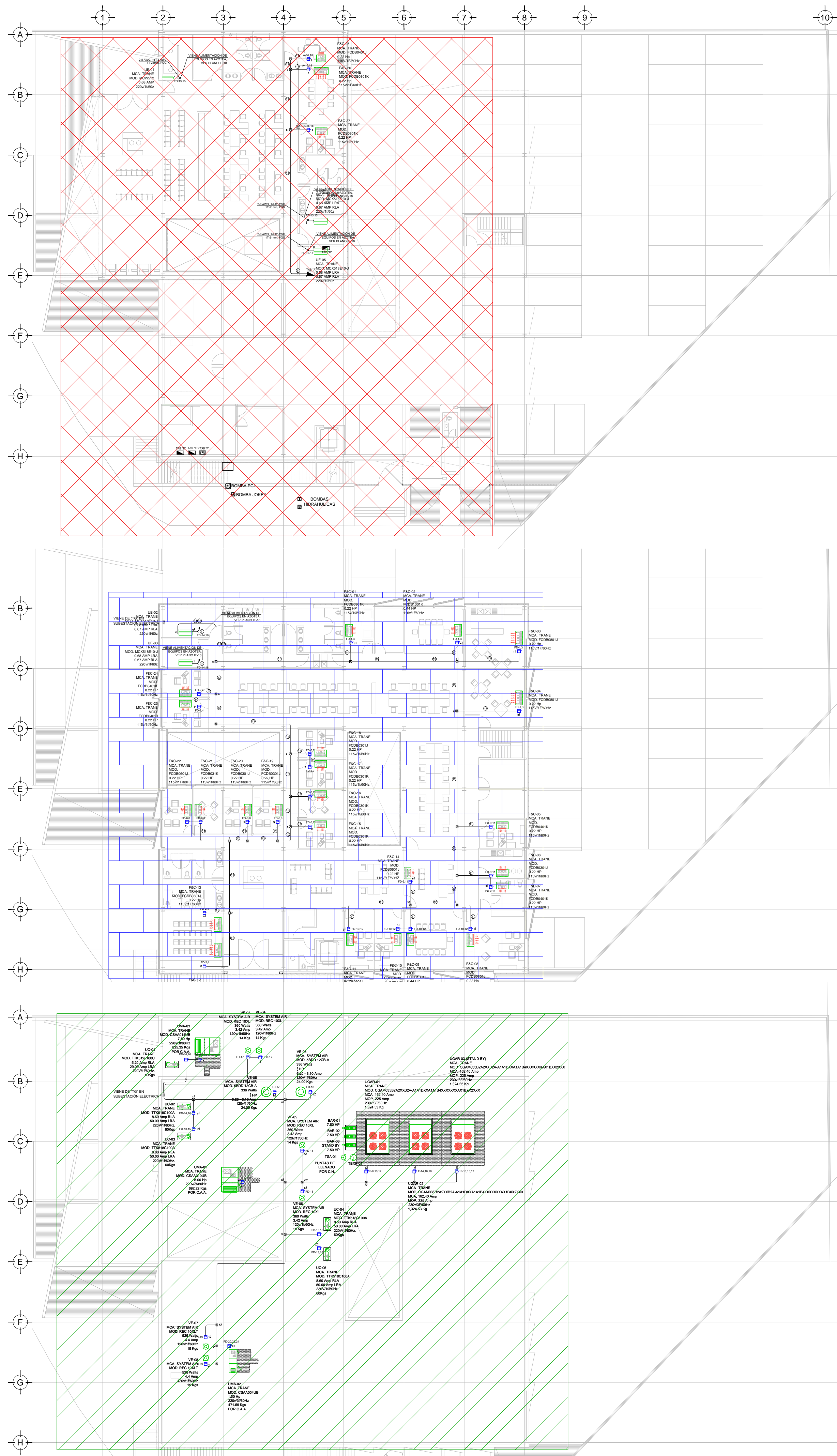
PLANO LLAVE N.P.T. ±0.00 , +0.60 mts. ESC: 1:250