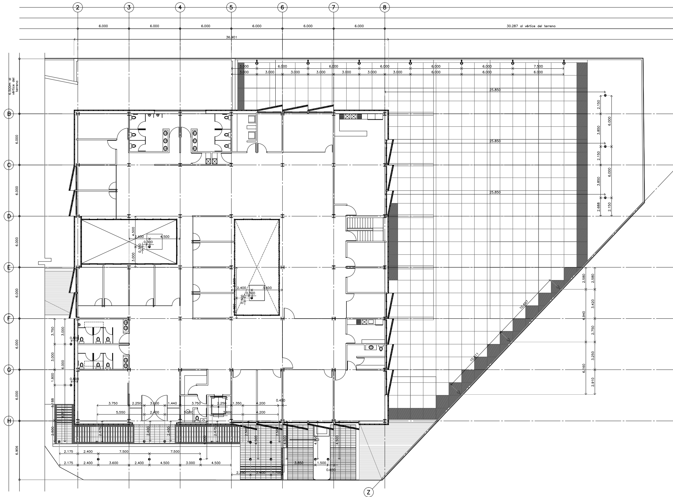
PLANTA ARQUITECTÓNICA DELEGACIÓN Y ESTACIONAMIENTO NIVELES +3.900 Y +0.600 DETALLE LUMINARIAS EXTERIORES