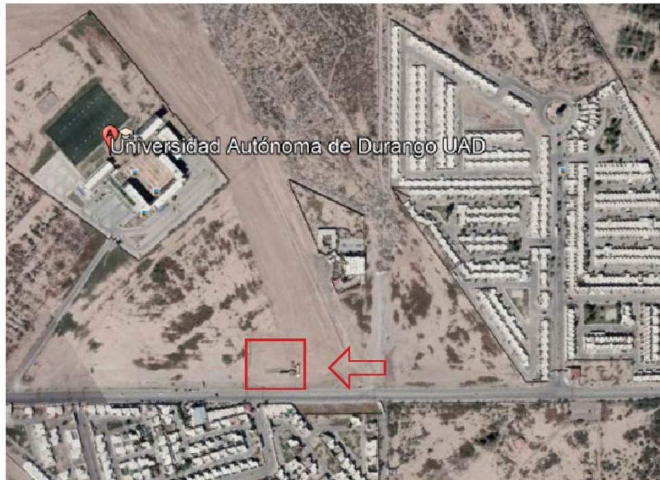
Fig. 1 Localización del emplazamiento del "CESI GÓMEZ PALACIO".

Compuesto por un predio de forma rectangular y topografía plana. Con base a la constancia de alineamiento las medidas generales son las siguientes, al Norte, Este y Oeste colinda con un predio particular y al Sur con con la calle Industrial Durango.