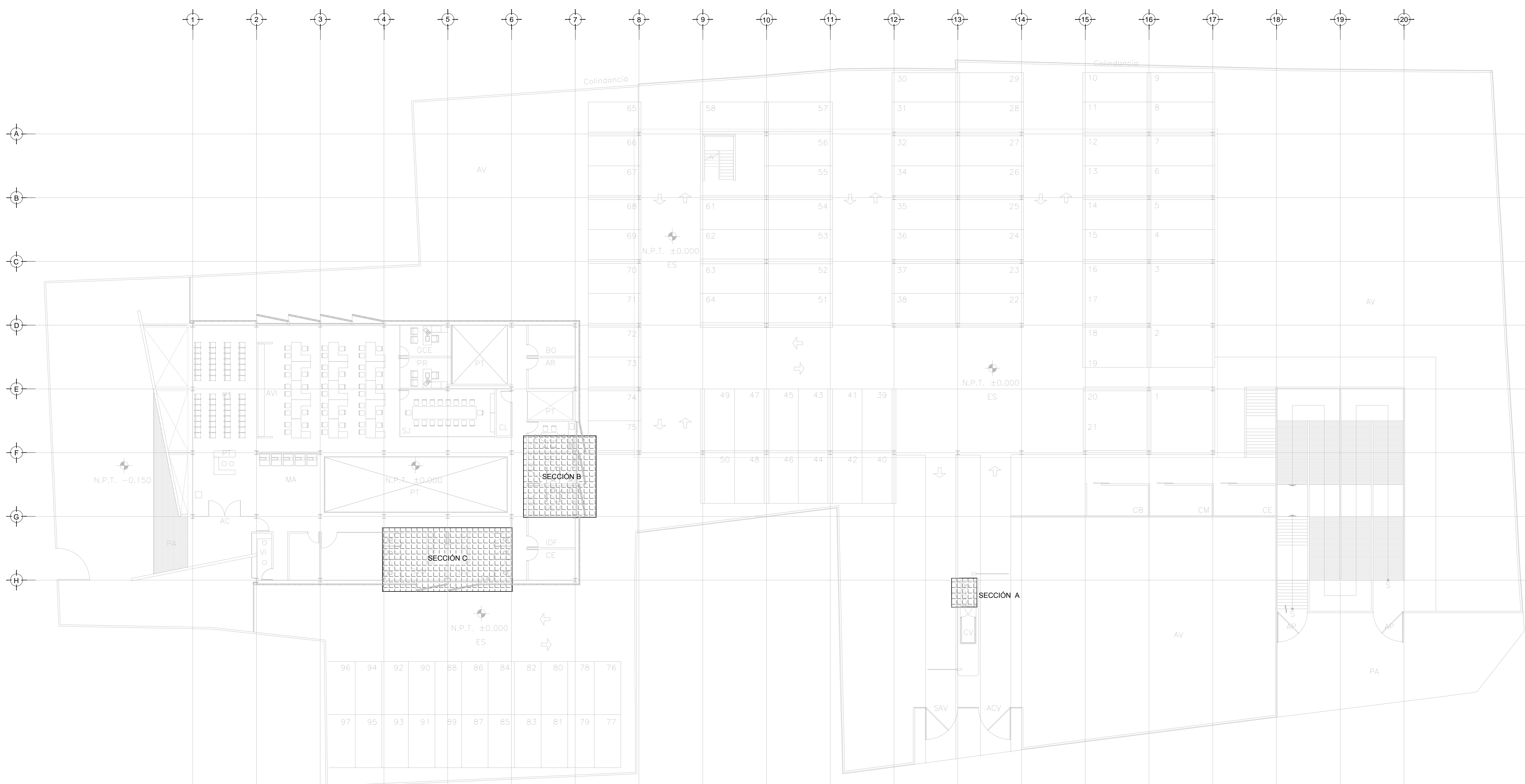
DRENAJE SANITARIO - PLANO LLAVE PLANTA - ESTACIONAMIENTO NIVEL ±0.00 ESC: 1/200

Este plano sustituye a los anteriores. REVISIÓN - 00 2 marzo 2018