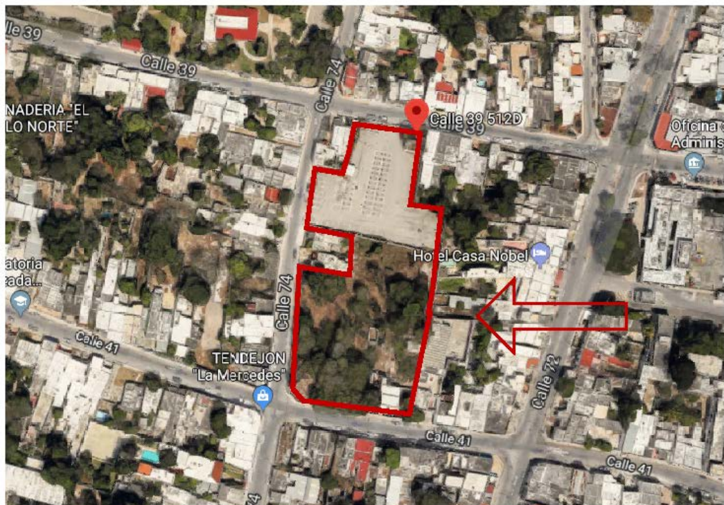
Fig. 1 Localización del emplazamiento del “CESI Mérida”.

Compuesto por un predio de forma irregular y topografía plana. Con base a la constancia de alineamiento las medidas generales son las siguientes, al Norte colinda con la Calle treinta y nueve, al Este con predios particulares, al Oeste con el predio 438-B y la calle 74 y al Sur con la calle 41.