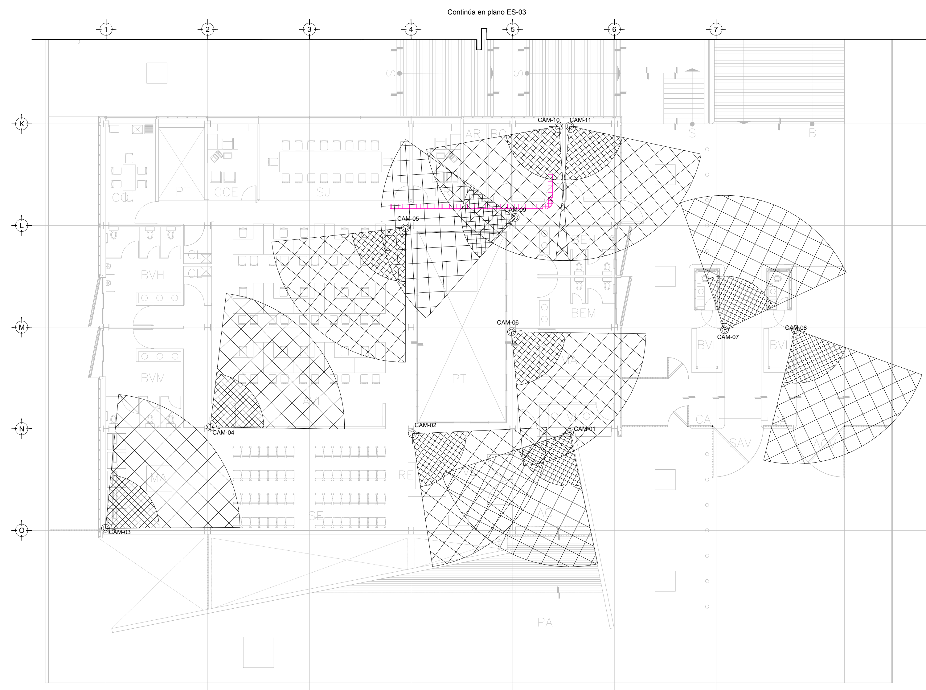
TENDIDO DE INSTALACIÓN CCTV N.P.T ±0.00 ms. ESC: 1:125