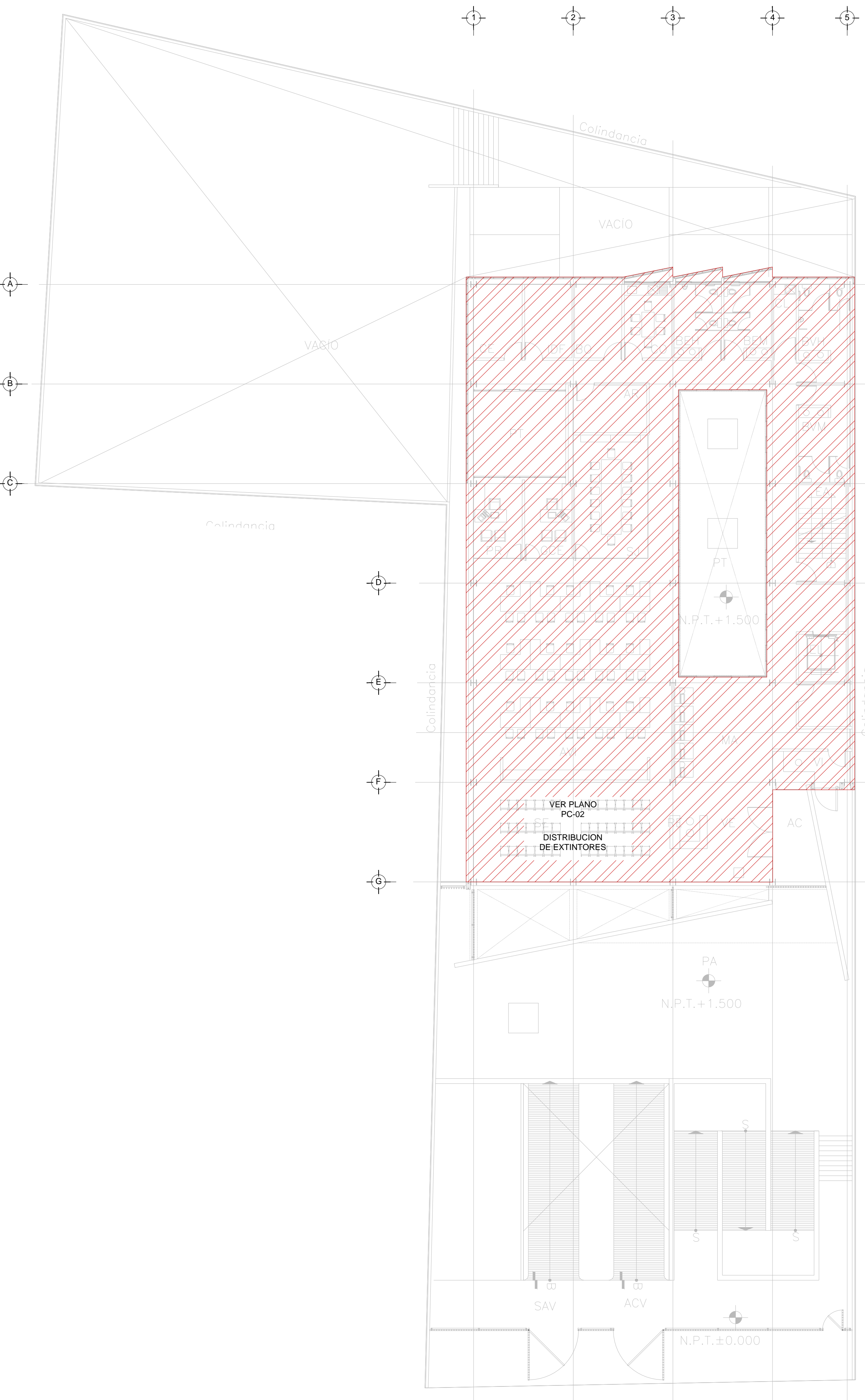
PLANTA NIVEL 0.00 Y +1.50 - CESI ESC. 1:125