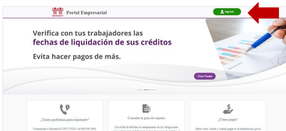
Imagen 1. Página de inicio del Portal Empresarial

El sistema solicitará la siguiente información para ingresar a tu cuenta (imagen 2):