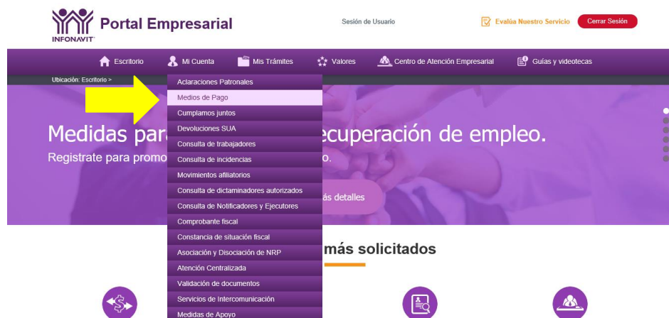
Imagen 3. Mis Trámites.