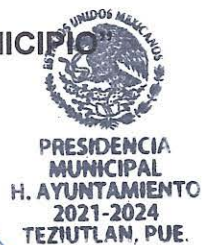
CARLOS ENRIQUE PEREDO GRAU PRESIDENTE MUNICIPAL

ÚLTIMA HOJA DE FIRMAS DEL CONVENIO DE COLABORACIÓN DE FECHA 08 DE DICIEMBRE DE 2023, QUE CELEBRAN EL INSTITUTO DEL FONDO NACIONAL DE LA VIVIENDA PARA LOS TRABAJADORES Y EL MUNICIPIO DE TEZIUTLÁN, PUEBLA.