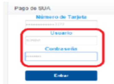
Imagen 1. Acceso