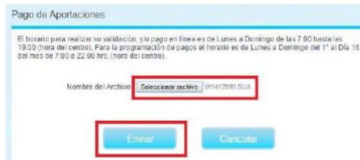
Imagen 3. Carga de archivo SUA